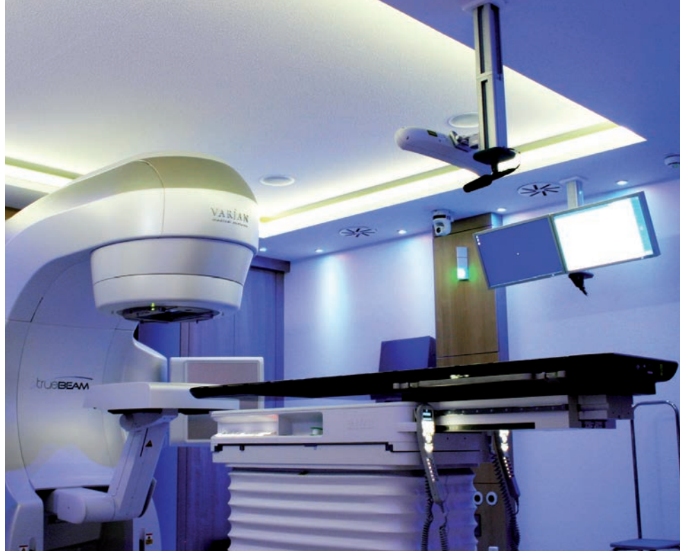
Lichtdesign: Christian Mentrup, NextMove